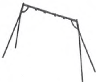
Качели на стойках двойные металл 004155