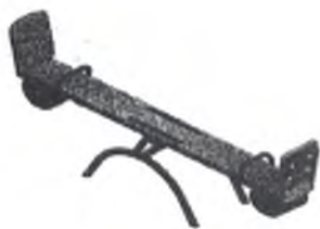
Качалка-балансир малая 004102