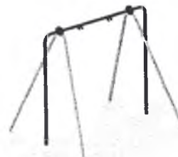
Качели на металлических стойках 004154 + Сиденье для качелей 004960