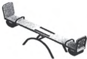
Качалка-балансир малая 004102