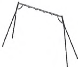
Качели на стойках двойные металл 004155